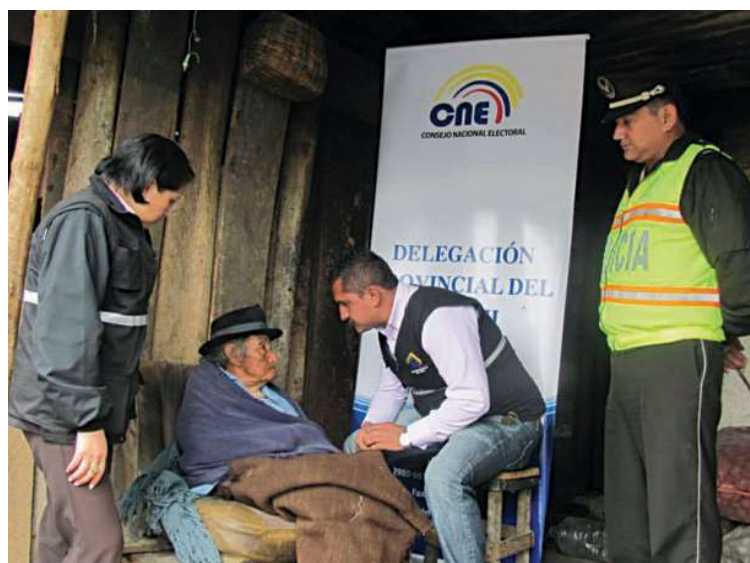
▲ El Consejo Nacional Electoral puede visitar los domicilios para recibir el voto de la persona que así lo solicitó.

Estas medidas también incluyen ofrecerles una mesa preferente, en un lugar de fácil acceso dentro de los recintos electorales, donde se brindan todas las ayudas, por ejemplo, plantillas en braille para las personas con discapacidad visual. Otro beneficio consiste en el voto a domicilio, si hubiera alguna persona que necesite hacerlo de esa forma. También está el taxi-amigo , que les lleva y trae de vuelta del lugar del sufragio, a un precio mínimo.