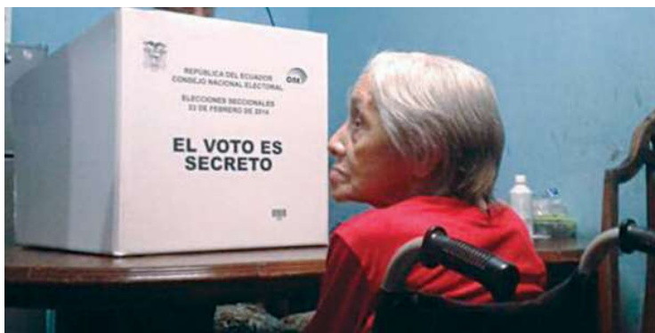
Maya Ediciones - Flavio Muñoz

Personas adultas mayores son los hombres y mujeres que han cumplido 65 años y más. Por alcanzar esta edad, tienen algunos beneficios que reconocen su esfuerzo a lo largo de su vida, por ejemplo, el voto facultativo, reconocido desde la Constitución de 1998 y ratificado por la Constitución de 2008. Hasta esa fecha, ninguna Constitución hace mención al ejercicio de este derecho en forma específica para las personas adultas mayores, por lo que estaban incluidas en el grupo de las personas mayores de 18 años, que sabían leer y escribir y que estaban obligadas a sufragar, siempre y cuando estén en goce de sus derechos políticos.